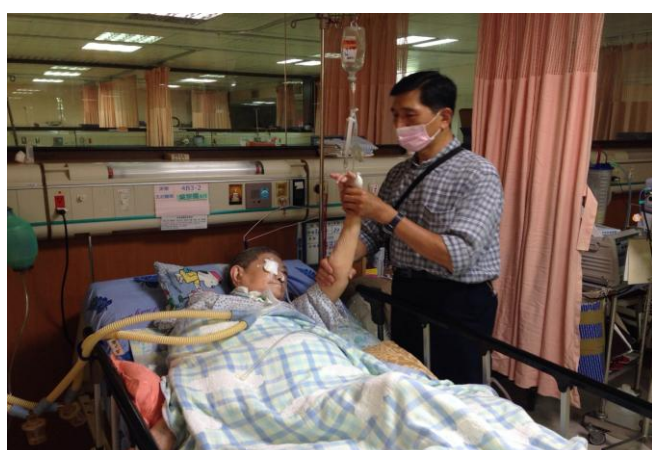
家屬隨時探視協助病人肢體活動