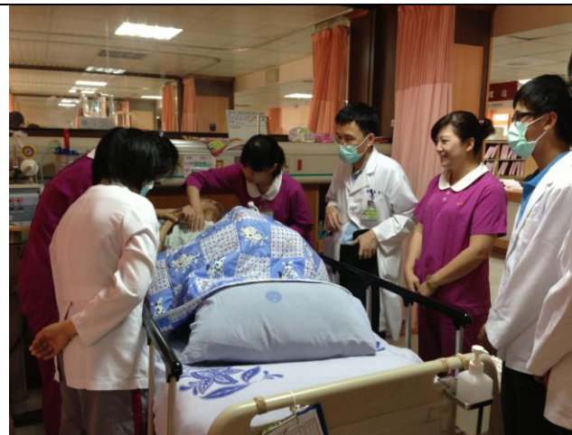
醫療團隊每日巡視病人病況