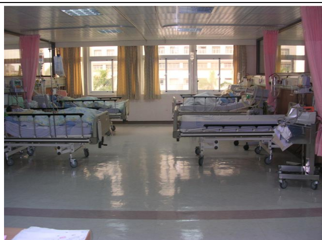
採光明亮寬廣舒適的照護環境